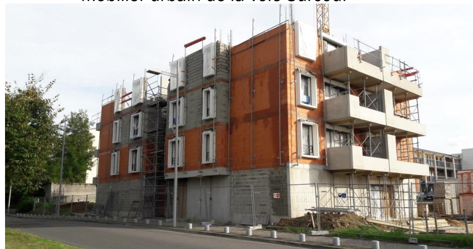
Construction d'une résidence sur le terrain du JSport