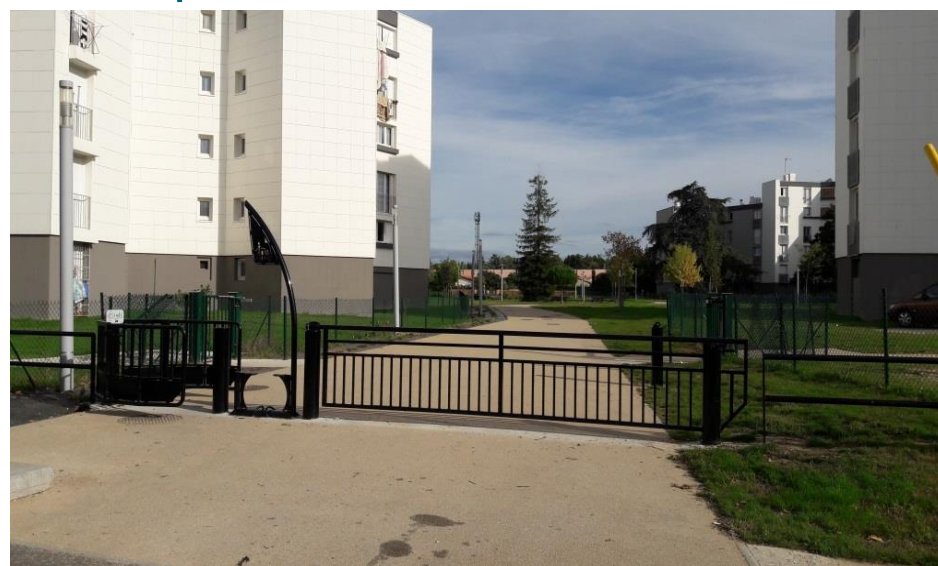
Mobilier urbain de la voie Surcouf