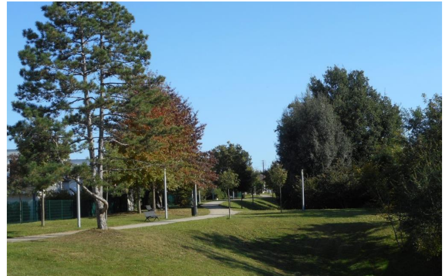
La coulée verte