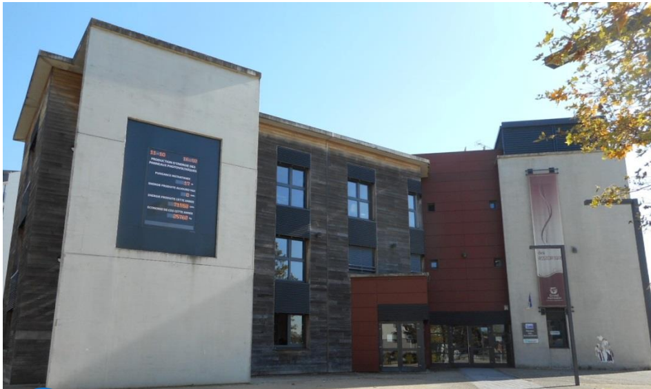
La maison des associations