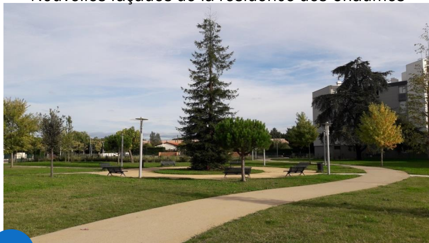
La place des Chaumes et son mobilier urbain