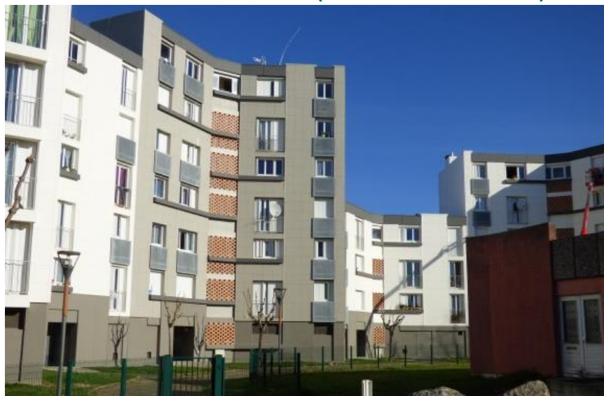
Nouvelles façades de la résidence des Chaumes