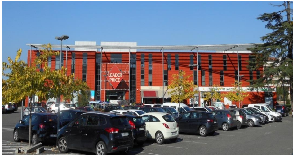
Le pôle solidarités et le centre commercial